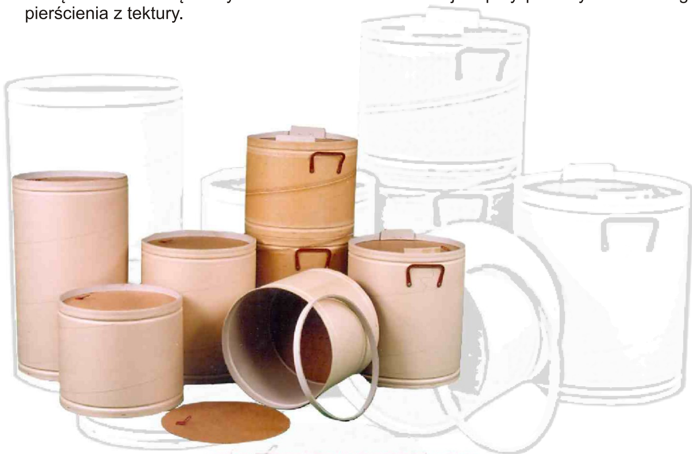
BĘBNY TEKSTUROWE BEZOBREĆCZOWE

W bębnach bezobrzęczowych dno i wieko mocowane jest przy pomocy dodatkowego pierścienia z tektury.